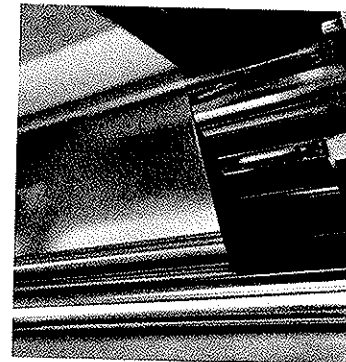
Wachskaschierung von Aluverbunden.